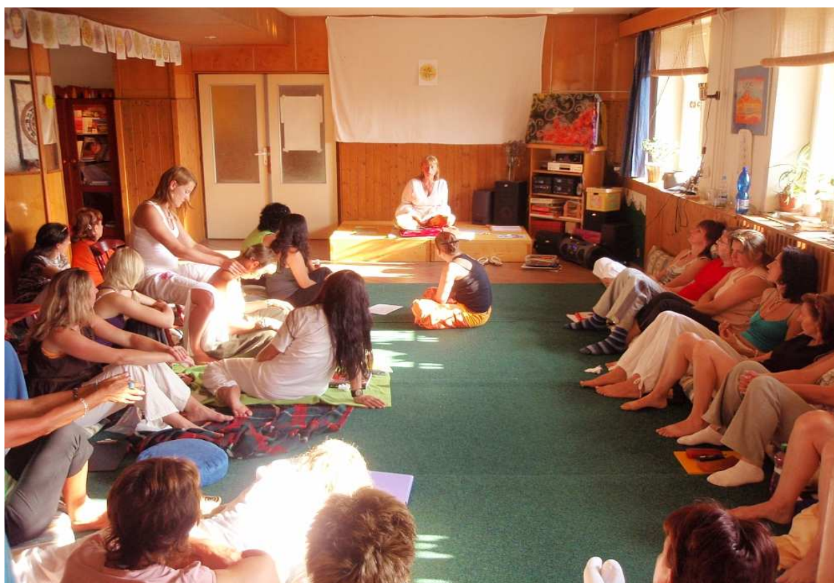
Oneness Centrum Rusava - větší místnost v přízemí