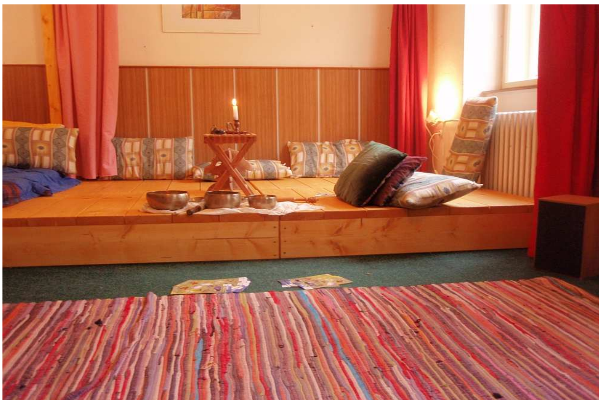
Oneness Centrum Rusava - menší místnost na patře pro 10 – 15 lidí